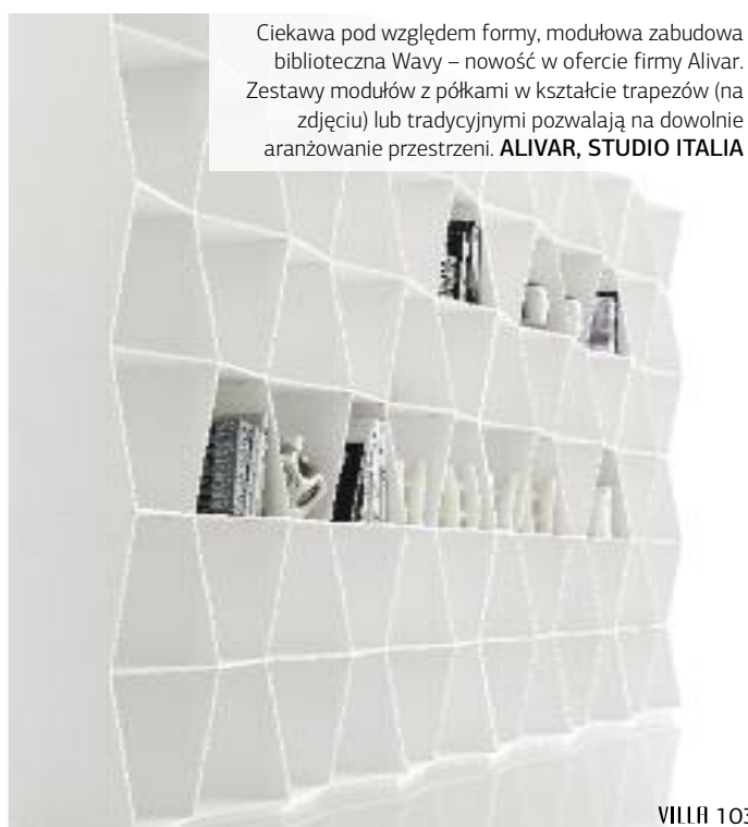
Ciekawa pod względem formy, modułowa zabudowa biblioteczna Wavy – nowość w ofercie firmy Alivar. Zestawy modułów z półkami w kształcie trapezów (na zdjęciu) lub tradycyjnymi pozwalają na dowolnie aranżowanie przestrzeni. ALIVAR, STUDIO ITALIA