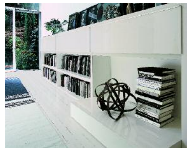
Modułowy system biblioteczny Maxim firmy Lema. Można go dowolnie komponować z paneli, półek i szuflad. Kompozycja na zdjęciu w zależności od wykończenia kosztuje od 22 200 zł. 3F STUDIO