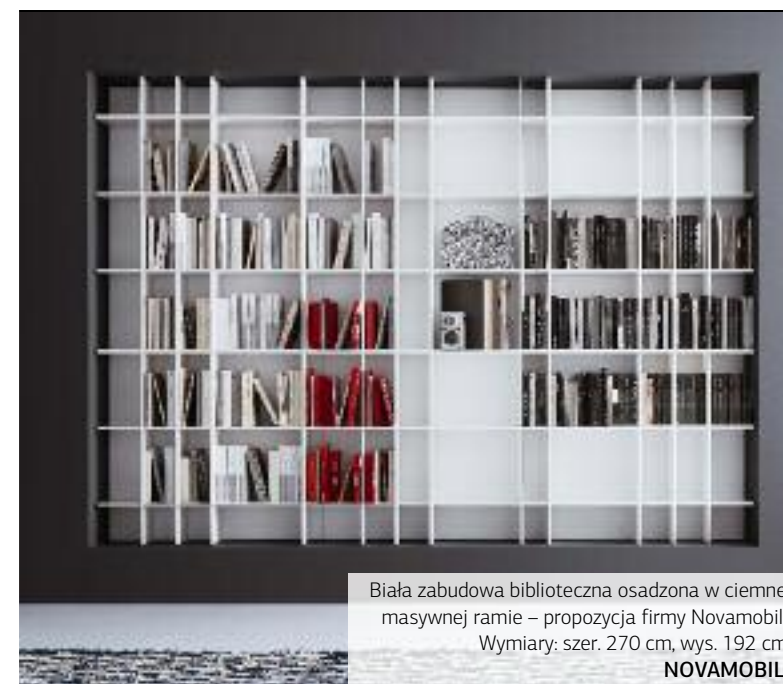
Biała zabudowa biblioteczna osadzona w ciemnej masywnej ramie – propozycja firmy Novamobili. Wymiary: szer. 270 cm, wys. 192 cm. NOVAMOBILI

W NOWOCZESNYCH MIESZKANIACH, A NAWET APARTAMENTACH RZADKO URZĄDZA SIĘ BIBLIOTEKI W ODDZIELNYCH POMIESZCZENIACH – TO ROZWIĄZANIE SPOTYKA SIĘ OBECNIE PRAWIE WYŁĄCZNIE W DOMACH. GDZIE WIĘC PRZECHOWUJE SIĘ I EKSPONUJE KSIĄŻKI? W POKOJU DZIENNYM, SYPIALNI, GABINECIE, A NAWET W HOLU